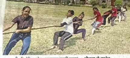
रस्साकशी प्रतियोगिता जोर आजमाइश करती छात्राएं

जासं, लखनऊ: कालीचरण पीजी कॉलेज में अंतर संकाय रस्साकशी प्रतियोगिता हुई। शारीरिक शिक्षा विभाग की ओर से हुई प्रतियोगिता में पुरुष वर्ग में बीए द्वितीय वर्ष एवं महिला वर्ग में बीए प्रथम वर्ष ने खिताब अपने नाम किया।