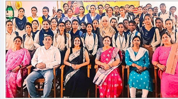
कालीचरण पीजी कॉलेज में महिला प्रकोष्ठ द्वारा आयोजित कार्यक्रम में शामिल शिक्षक व छात्राएं।