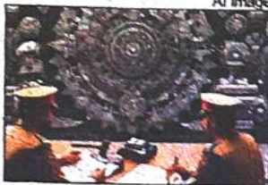
Al Image फ्रॉड से बचना है तो रहें सावधान